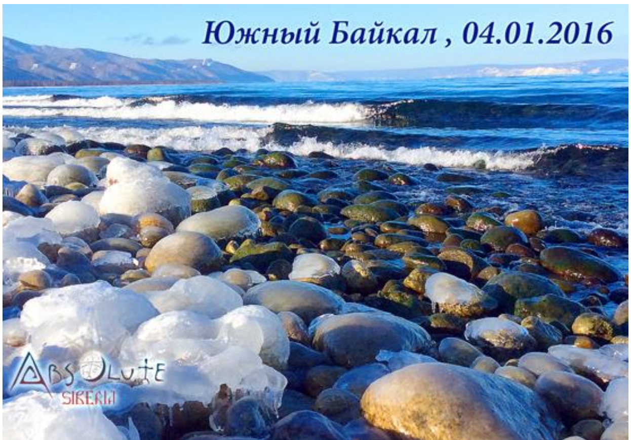
На восточном берегу Байкала волны плещут до 10-го января 2016 г.