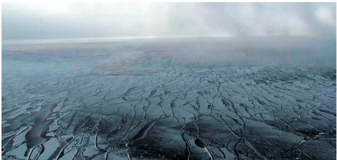
20 января 2016 г. льдины стали смерзаться в истоке реки Ангара(пос. Листвянка, западный берег)